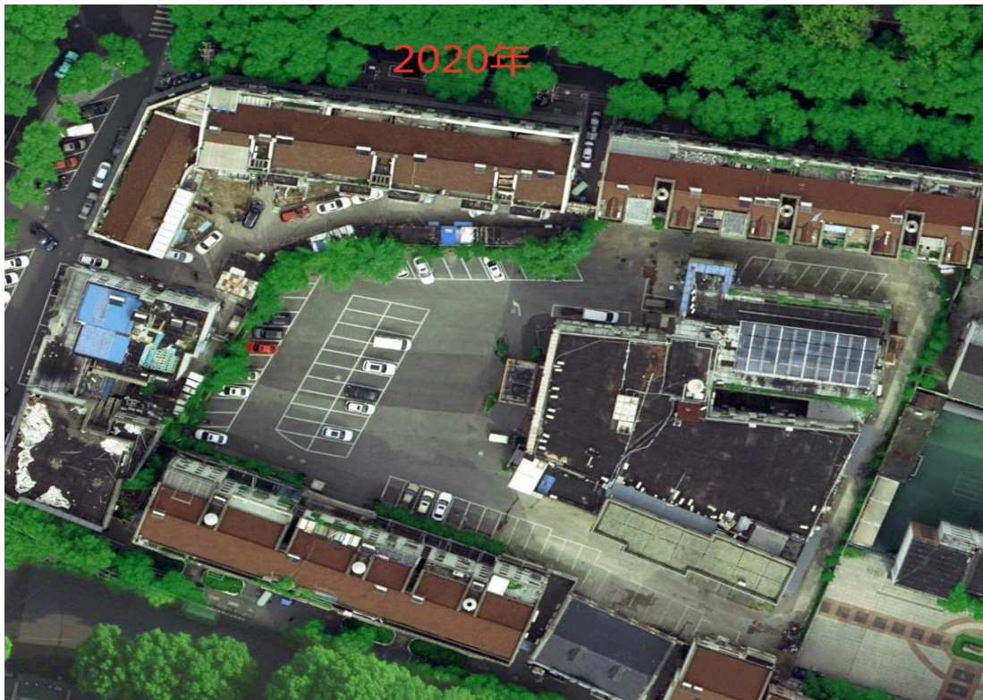
图 5 2020 年航拍影像图

2020 年 2 月 18 日，王安石通过司法拍卖取得涉事建筑所有权。2020 年 4 月 26 日，王安石将该涉事建筑转移登记至自己名下，取得不动产权证，证书存根显示房屋结构钢筋混凝土，总层数 4 层，房屋建筑面积 5338.5 平方米（见图 5）。法院拍卖评估报告显示建设年代约为 2010 年。