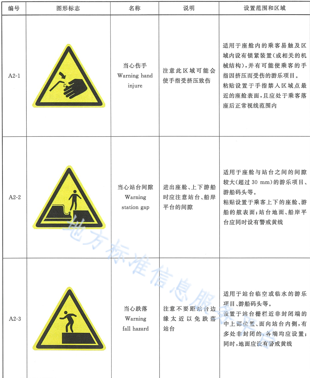
表 A.2 警告标志