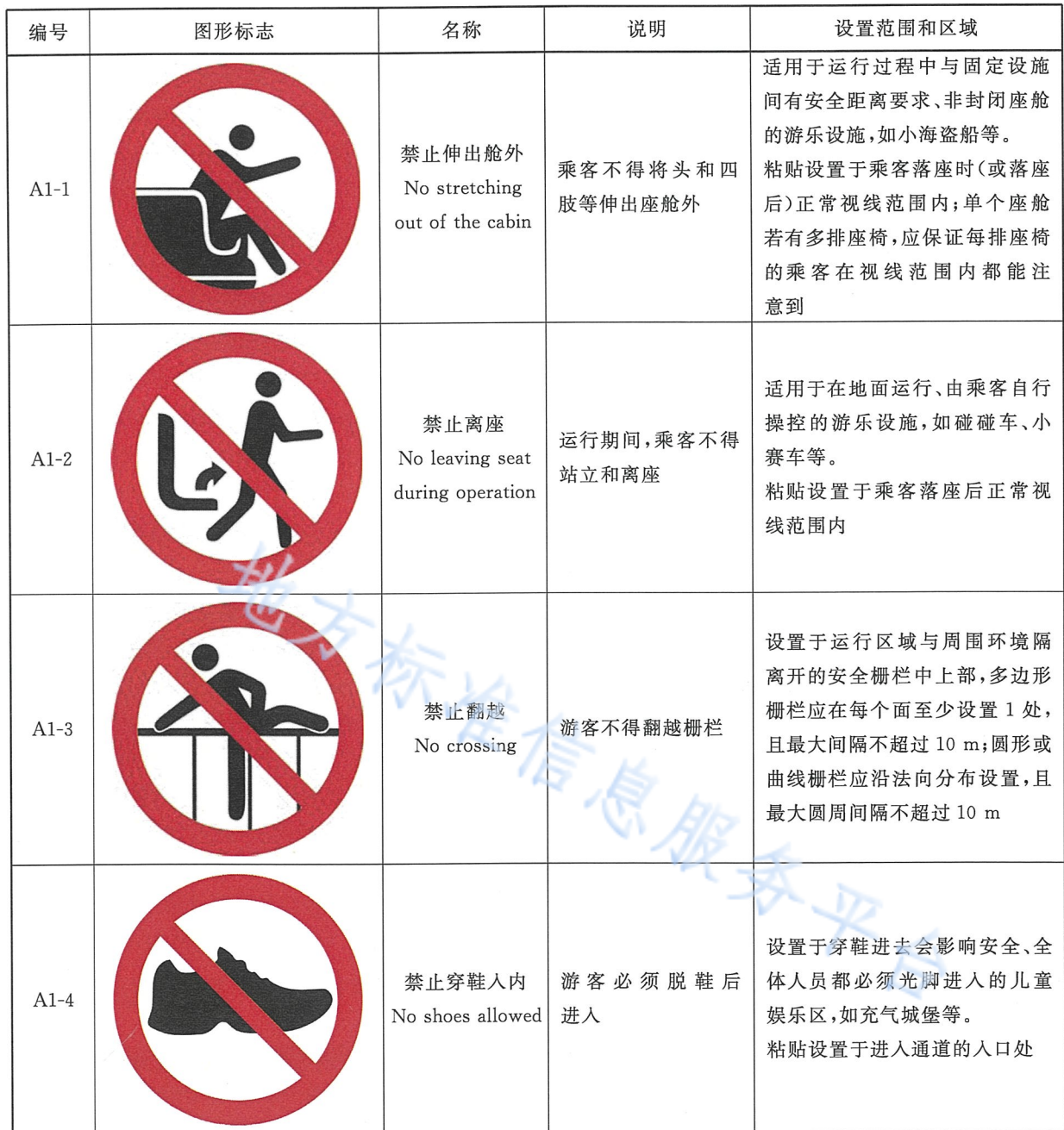
表 A.1 禁止标志