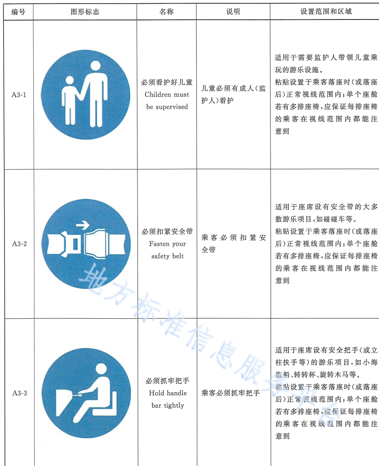
表 A.3 指令标志