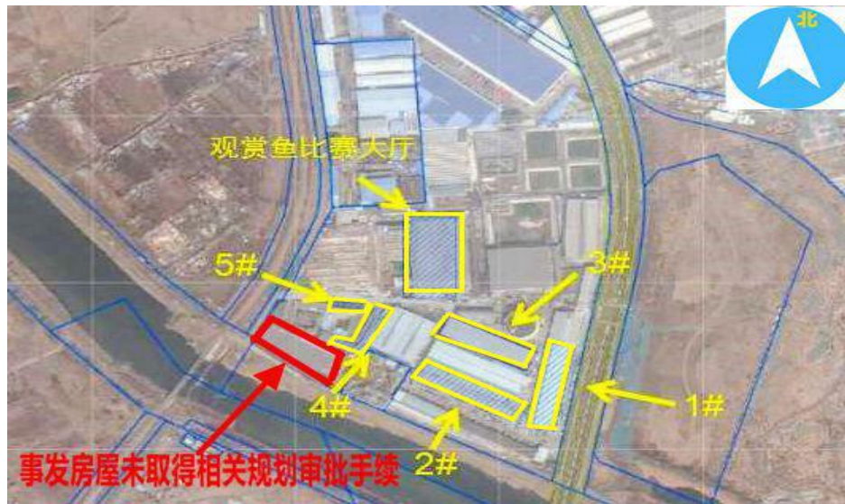
图 2 事发土地地上房屋规划审批情况示意图