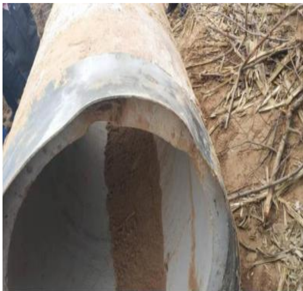
水泥套管钢承口（已变形）