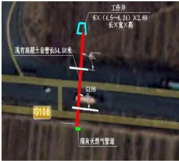
顶管施工现场示意图