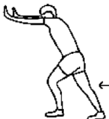
图 A.11 小腿拉伸动作示意图

站立,双手向前推墙,两腿做弓步,一条腿在前弯曲,保持后腿伸直,双脚平放不得离开地面。前腿弯曲,身体前倾,移动臀部做推墙的姿势。保持 10 s~15 s,换另一侧,并重复相同动作,动作中配合呼吸。如果要进一步伸展跟腱,也可以弯曲后腿。如图 A.11 所示。