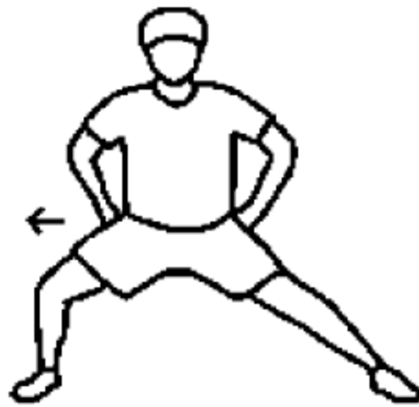
图 A.9 大腿内侧拉伸动作示意图

站立, 两脚分开, 保持脚尖向前, 两脚平行。一侧腿屈曲下蹲, 另一侧腿完全伸直, 双脚任何一个部位不能离开地面。双手放在腰的两侧, 挺胸收腹, 腰背部挺直。保持 10 s~15 s 后, 屈曲下蹲的腿蹬地站起, 还原初始位置。换另一侧, 并重复相同动作, 动作中配合呼吸。如图 A.9 所示。