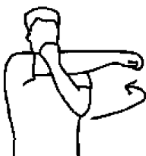
图 A.3 上臂外侧拉伸动作示意图