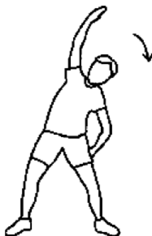
图 A.5 侧腰拉伸动作示意图

双脚打开与肩同宽,身体不要前倾,一侧手臂向上伸直横越头部向外伸展。另一手支撑在身体的同侧,腰部向外弯曲伸展,弯曲 10 次~15 次,换另一侧,并重复相同动作,动作中注意配合呼吸。如图 A.5 所示。