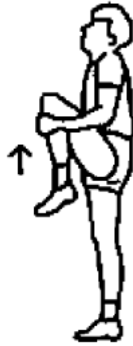
图 A.8 大腿后侧拉伸动作示意图