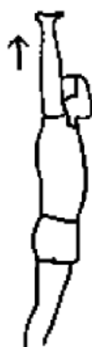
图 A.4 腹部拉伸动作示意图

双手手掌交叉互握,向上推伸并缓慢举过头顶,直到腹部感觉到紧绷时停住,保持 10 s~15 s,注意配合呼吸。如图 A.4 所示。