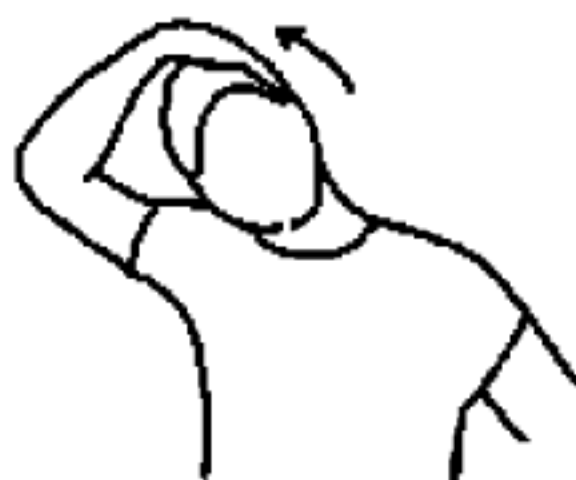
图 A.1 颈部拉伸动作示意图

一侧手举过头顶,将头部向这一侧轻轻拉动,重复 5 次~10 次,换另一侧,动作中配合呼吸。如图 A.1 所示。