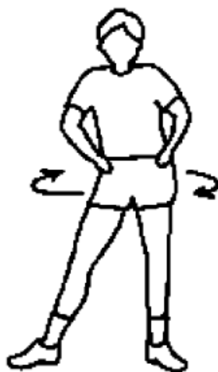
图 A.6 摆胯及绕胯动作示意图

直立,双腿分开略比肩宽,双腿微屈,手放在胯骨上。上身正直,利用腰胯力量使胯部左右摆动各 10 次,注意腹部收紧。然后顺时针逆时针环绕各 10 圈。如图 A.6 所示。