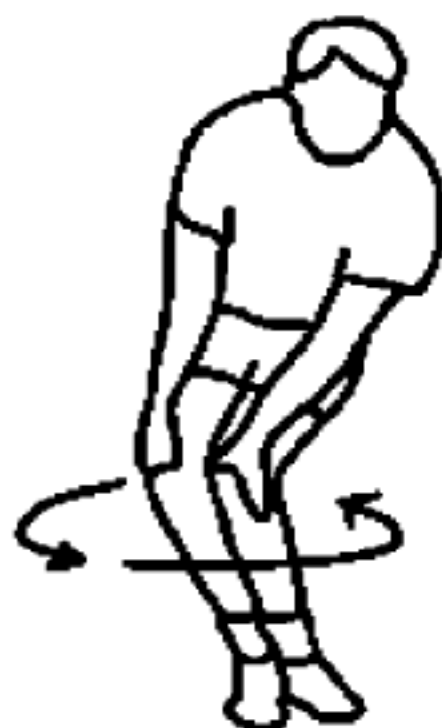
图 A.10 绕膝动作示意图

两膝靠拢, 屈膝半蹲, 两手扶膝, 轻轻转动膝部, 绕着同一方向转动 10 次~15 次, 换相反方向, 并重复相同动作, 动作中配合呼吸。如图 A.10 所示。