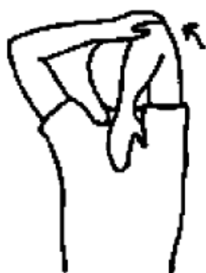
图 A.2 上臂内侧拉伸动作示意图

一手抓着另一手的肘关节,向着头部方向缓慢地往后拉伸,直到手触摸到后背。保持 10 s~15 s,换另一侧,并重复相同动作,动作中配合呼吸。如图 A.2 所示。