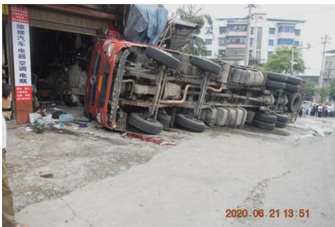
图2 事故现场车辆侧翻情况