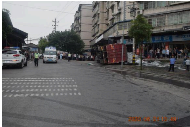
图1 事故现场道路情况