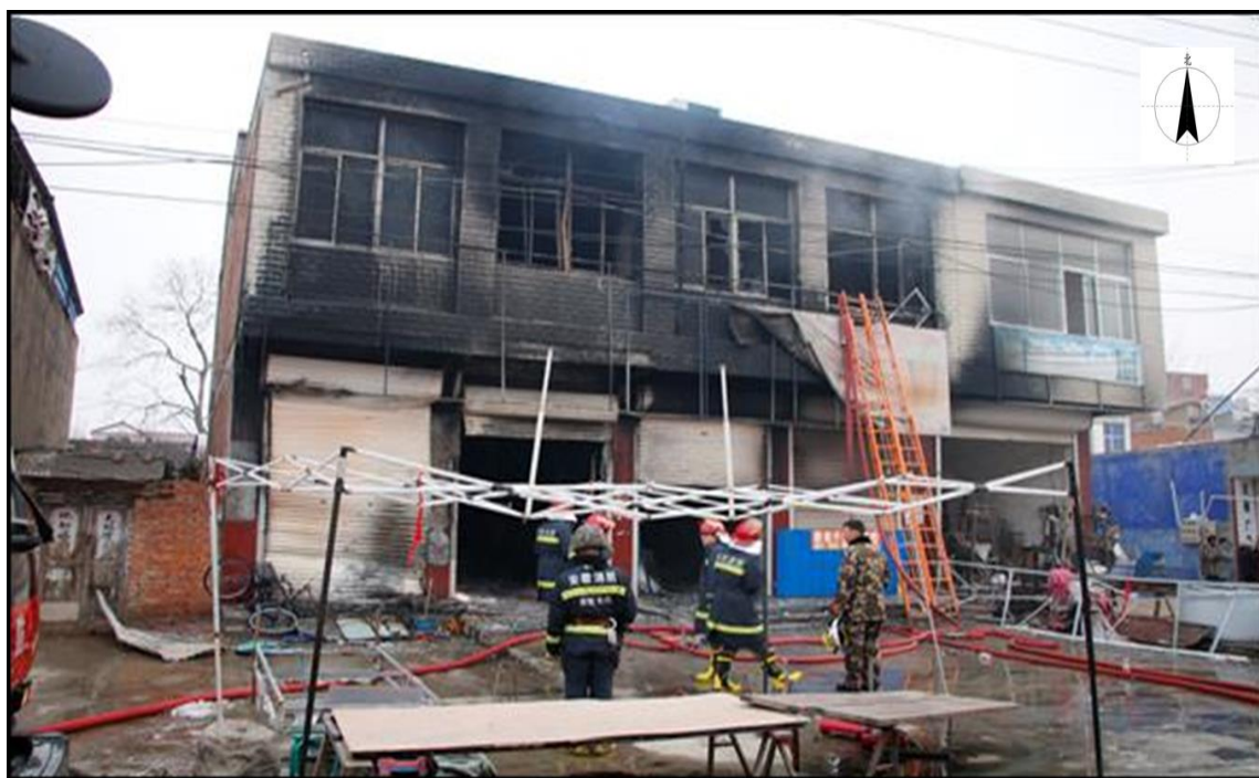
图 1 事发后建筑物外观轮廓

起火建筑物坐北朝南，东侧为村民孙涛（男，45 岁，公民身份号码：34212219*****8250）自建房并租赁他人从事门窗等防盗设施制作经营，南侧为乡镇道路，西侧为巷道，北侧为后院。起火建筑物二层外窗均未加装防盗等设施（见图 1）。