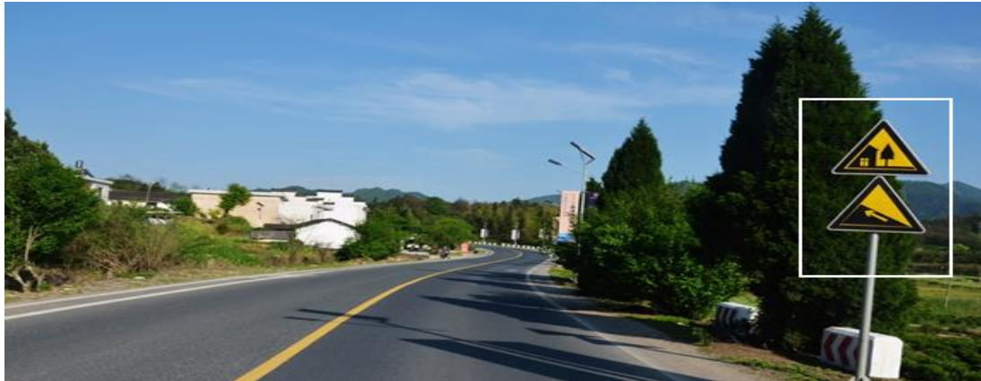
事故路段现场环境图