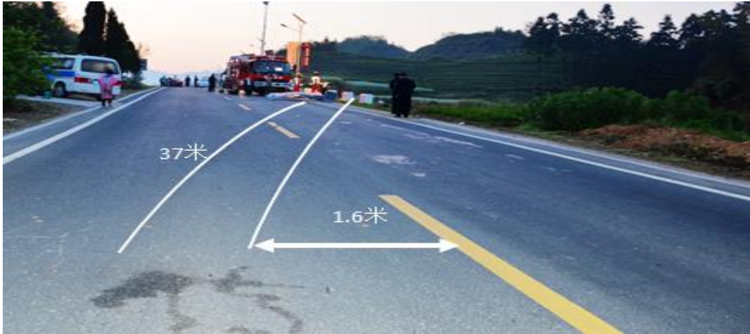
事故车辆侧滑后呈逆向行驶示意图

发时车辆在向右转向发生侧滑，呈逆向行驶状态（事故车辆侧滑后呈逆向行驶示意图如下）。