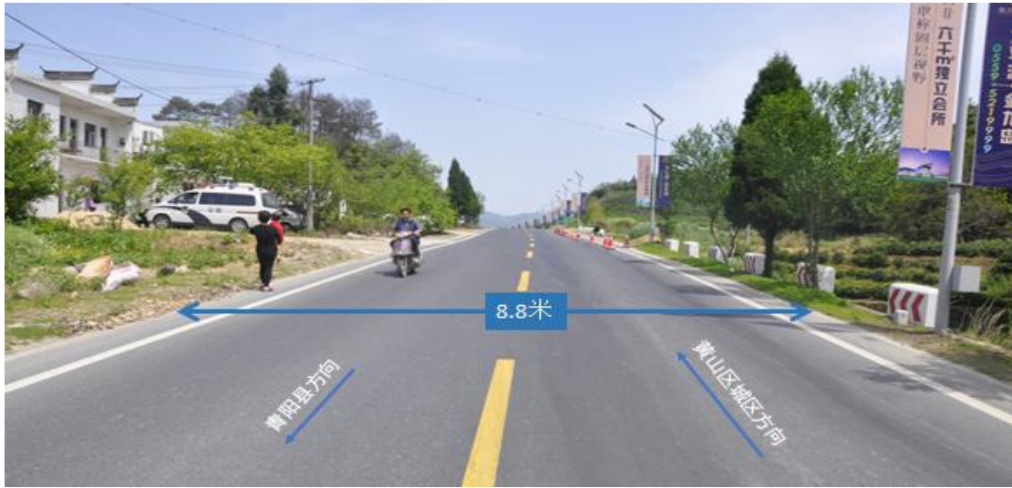
事故路段路面示意图

区城区方向，西往太平湖镇广阳村方向，路基宽约12米，双向两车道，路面为沥青混凝土、干燥、平整完好，路面宽约9米，路面中央逆向车道分界线为黄色单虚线，边缘线为白色实线，夜间无路灯照明（事故路段路面示意图如下）。