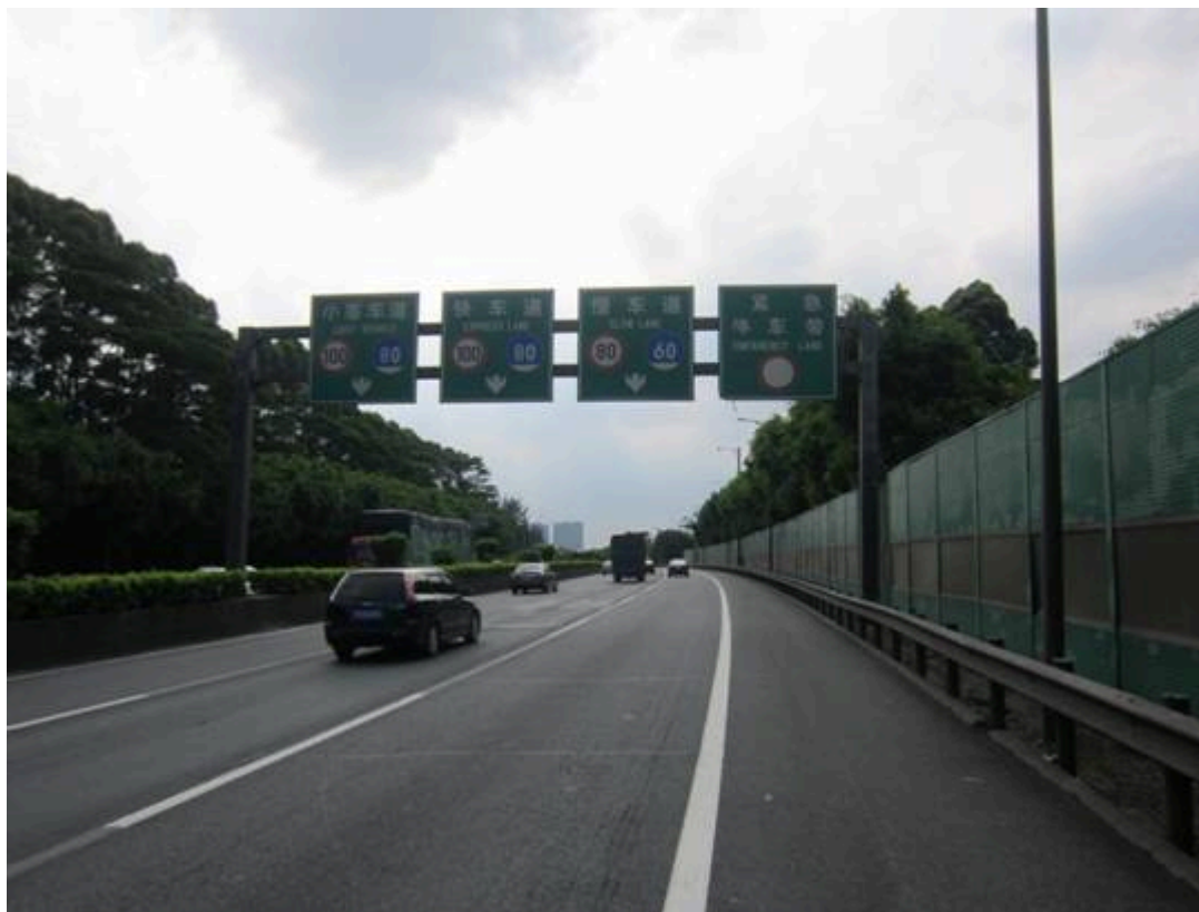
图4 事发路段指示标志情况