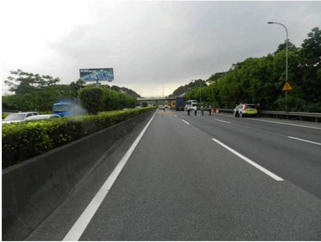
图3 事发路段路面情况