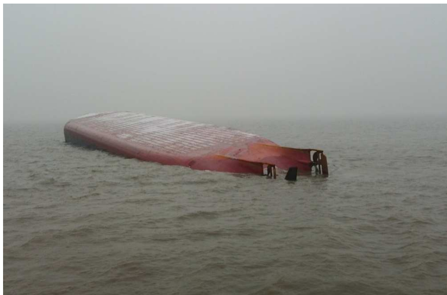
“皖无为货 1588”轮倾覆照片

2015年11月28日1830时许，“皖无为货 1588”轮在营口李家礁海域（40° 12.24'N/121° 48.80'E）倾覆沉没。事发时船上共8人，2人获救，1人死亡，5人失踪。事故等级为较大事故。